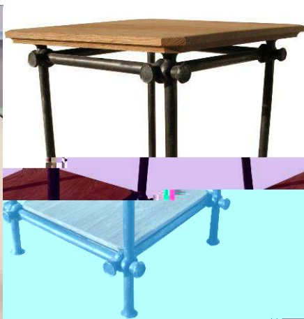
Table de chevet