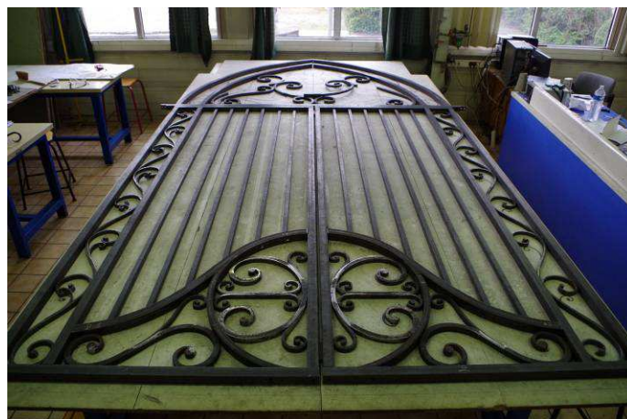
Portail pour Eglise