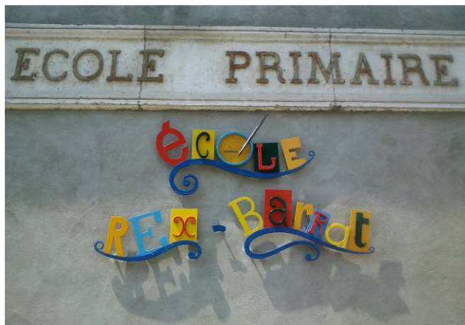
Enseigne Ecole Primaire